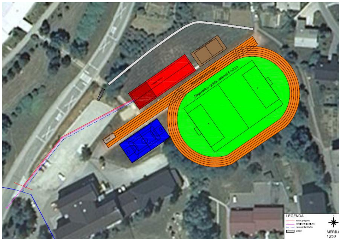
Slika 2: Idejni osnutek ureditve športnega parka (Športna zveza Trebnje in Mirna). Marec 2013.

Asfaltna podloga mora biti izdelana po navodilih strokovnjaka polytan-a, pregledana in prevzeta. V ceni zajeto tudi liniranje tekaške steze. Dobavljen material mora imeti certifikat IAAF in standard EN.