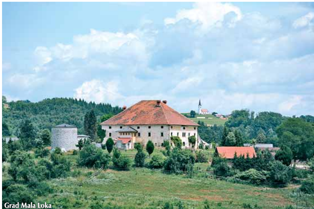
Grad Mala Loka