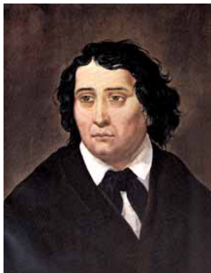
dr. France Prešeren (1800 – 1949)

9. 2., ob 19.00 proslava ob Slovenskem kulturnem prazniku - Kulturni dom Trebnje.