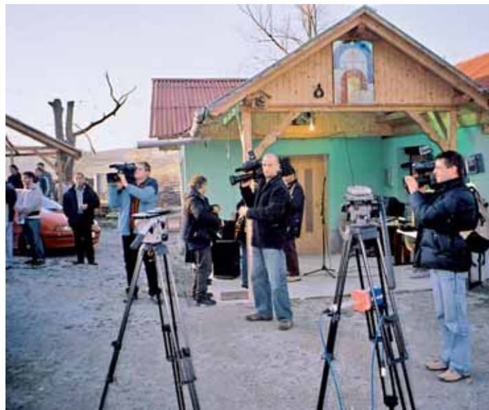
M.D. Številni snemalci zborovanja

Ali so Romi s tem zborovanjem dosegli cilj, pa bo pokazal čas. Kakšnih vidnih odmevov, kljub številni medijski prisotnosti, pa še ni čutiti. Se pa lahko vprašamo, če bi mediji dali tako veliko pozornost tudi krajanom KS Rače selo, KS Veliki Gaber in KS Velika Loka, če bi sklicali zborovanje in želeli javnost seznaniti s problemi, s katerimi se vsakodnevno soočajo.