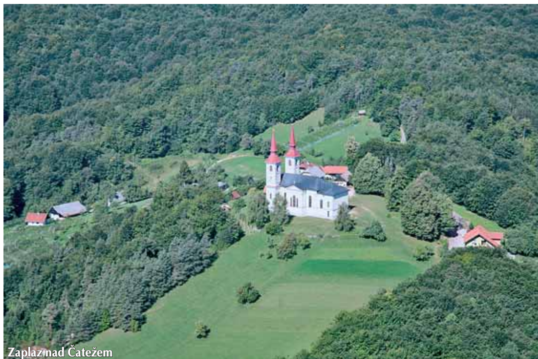
Zaplaz nad Čatežem