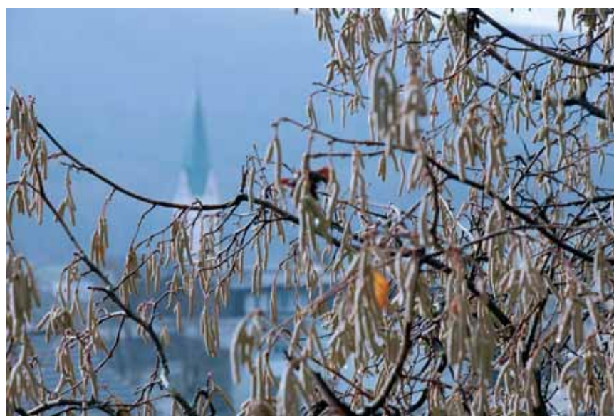
Lea Udovič Januarska pomlad, foto: Bruno Čibej