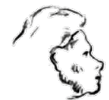
Odcep E7 Pot Mare Rupene